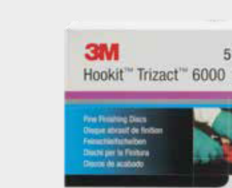
3M™ Trizact™ Feinschleifscheibe 6000, 150 mm