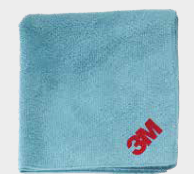
3M™ Perfect-It™ Hochleistungstücher