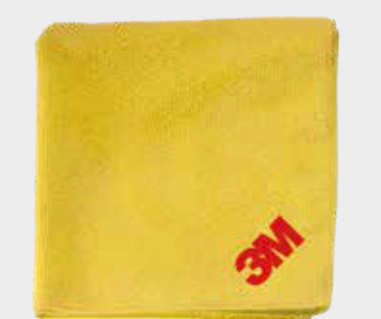
3M™ Perfect-It™ Hochleistungstücher