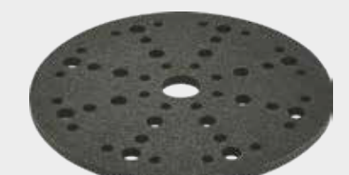
Festool Interface Pad