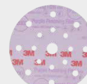
3M™ Hookit™ 260L+