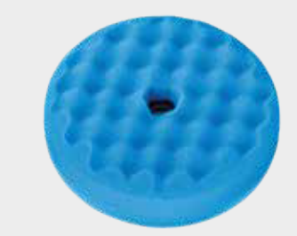
3M™ Perfect-It™ Quick Connect doppelseitiges, waffelförmiges blaues Polier-Pad