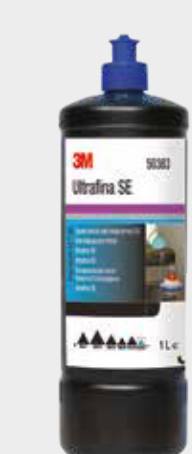
3M™ Perfect-It™ SE-Anti-Hologramm-Politur