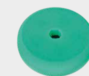
3M™ Perfect-It™ Quick Connect doppelseitiges, flaches, grünes Polierpad