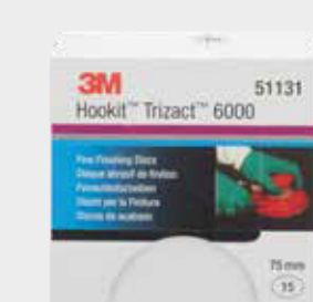
3M™ Trizact™ Feinschleifscheibe 6000, 75 mm