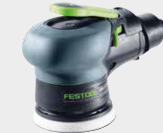
Festool LEX 3 77 Festool IAS-Adapter für Lex 2/3