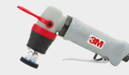
3M™ Mini-Schwingschleifer, Luftdruck