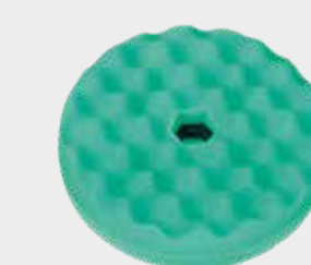
3M™ Perfect-It™ Quick Connect doppelseitiges, waffelförmiges grünes Polier-Pad