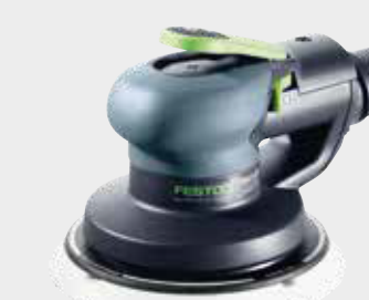
Festool LEX 3 150/3