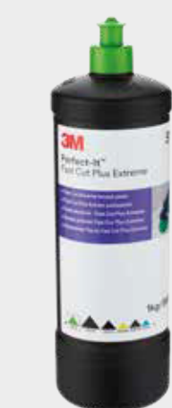
3M™ Perfect-It™ Schleifpaste Plus Extreme

Hinweis: Je weicher der Lack ist, desto niedriger muss die Temperatur und dementsprechend die Rotation in U/min sein.