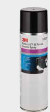
3M™ Perfect-It™ Finish-Kontrollspray

Hinweis: Es ist wichtig, sicherzustellen, dass Sie alle Schleifspuren in dieser Phase entfernen, um ihre erneute Erscheinung am Ende des Polierprozesses zu vermeiden.