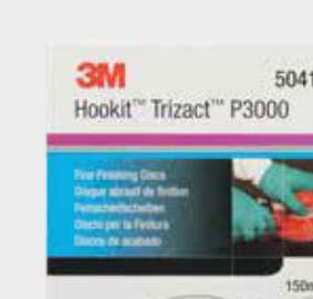
3M™ Trizact™ Feinschleifscheibe 3000, 150 mm