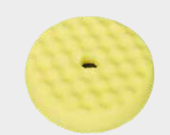
3M™ Perfect-It™ Quick Connect doppelseitiges, waffelförmiges gelbes Polier-Pad