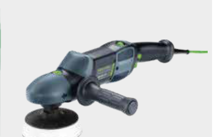
Festool SHINEX RAP 150