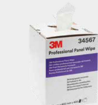
Professionelle 3M™ Karosseriereinigungstücher