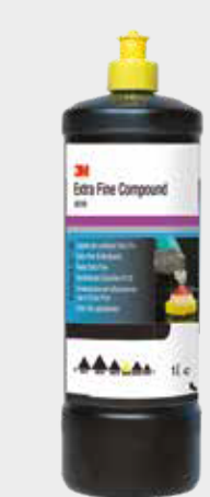
3M™ Perfect-It™ Extra-Fine PLUS